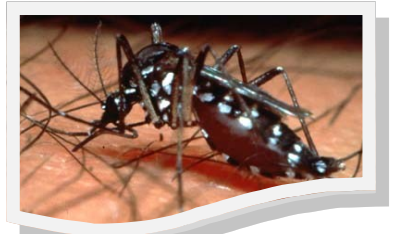
“ Aedes aegypti ”

El dengue clásico y el hemorrágico son enfermedades virales transmitidas a través de la picada de un mosquito infectado conocido como “ Aedes aegypti ”, es causada por cualquiera de cuatro virus estrechamente relacionados (DENV-1, DENV-2, DENV-3 ó DENV-4). Por lo tanto, una persona puede tener hasta cuatro enfermedades por dengue durante su vida. El mosquito hembra “ Aedes Aegypti ” es el principal transmisor o vector de los virus de dengue.